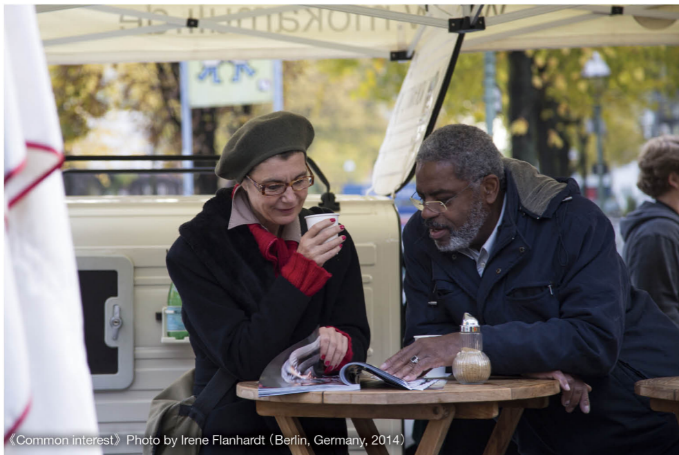
《Common interest》Photo by Irene Flanhardt (Berlin, Germany, 2014)