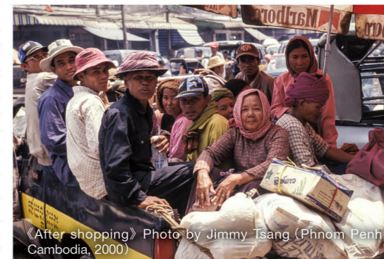
《After shopping》 (Phnom Penh, Cambodia, 2000)

▶ 沒人的地方就沒有市集，當中可愛之處是能夠容納不同人種及表情的臉，絕無違和感。