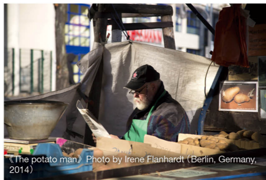
《The potato man》Photo by Irene Flanhardt (Berlin, Germany, 2014)

《世界市集風光》攝影展 日期：即日起至5月31日 時間：10:00am-10:00pm 地址：中環畢打街11號置地廣場3樓Landmark Atrium 查詢：范赫畫廊 (2882 3390)