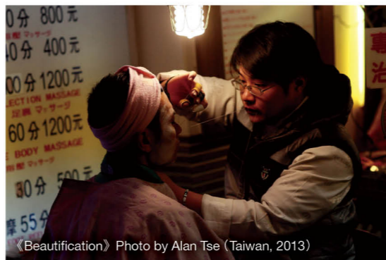
《Beautification》Photo by Alan Tse (Taiwan, 2013)

▶ 這位伯伯所賣之時尚單品，當然不及新沙洞款式走在潮流尖端，但當中的實用性，卻是伯伯想為人帶來溫暖、舒適的寓意。