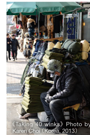
《Taking 40 winks》Photo by Karen Choi (Korea, 2013)

▲ 韓國最出名市集，不得不提位於首爾，每日開放的黃鶴洞跳蚤市場，除了同樣以古董單品最受人歡迎，還因為G-Dragon曾到此一遊，使不少粉絲久不久便發起「野生捕獲」行動。